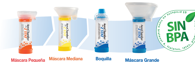
Máscara Pequeña Máscara Mediana Boquilla Máscara Grande