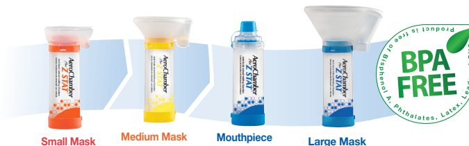
Small Mask Medium Mask Mouthpiece Large Mask

© 2005, 2010 Monaghan Medical Corporation™ and ® are trademarks and registered trademarks of Monaghan Medical Corporation or an affiliate of Monaghan Medical Corporation. This device was Made in the USA from Canadian and US parts.