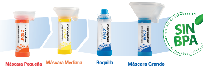
Máscara Pequeña Máscara Mediana Boquilla Máscara Grande