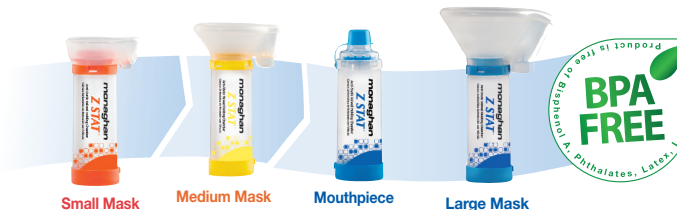
Small Mask Medium Mask Mouthpiece Large Mask

© 2010 Monaghan Medical Corporation™ and ® are trademarks and registered trademarks of Monaghan Medical Corporation or an affiliate of Monaghan Medical Corporation. This device was Made in the USA from US and Canadian parts.